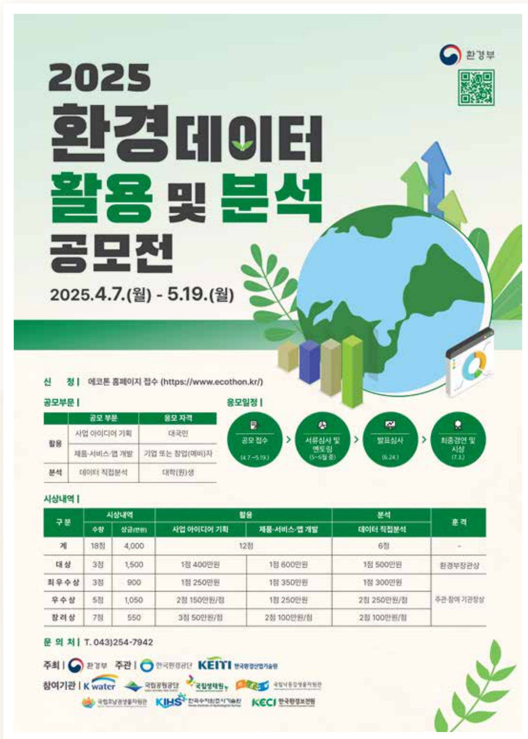
2025년도 환경데이터 활용 및 분석 공모전 포스터